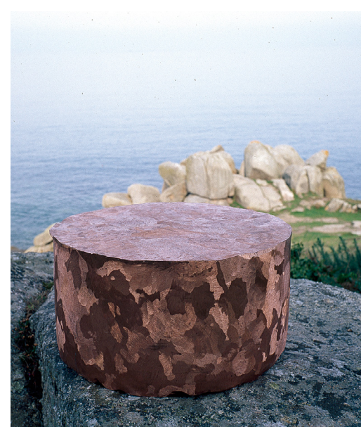
위 · <Intact> 쇠쇠 가변크기 2012 툴루즈 갤러리레마, 얇은 와이어를 엮어 머리카락 같은 덩어리를 만들었다. 연약한 재료가 모여 견고한 존재로 거듭나는 과정을 담았다. 아래 · <Centre> 구리 44×44×23cm 1987/1999 트레드레로크메오 공원