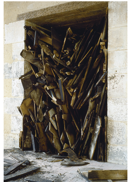
위 · 〈Non Finito〉 청동 68×68×65cm 2020 아래 · 〈Temp Accélérés〉 목재 122×152×225cm 1985 샤토루비엔날레(1985) 출품작. 불에 태운 나무로 공간을 채웠다. 조각의 건축성을 드러낸 초기작.